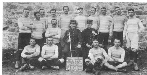
Équipe du S.C.T., année 1907. Collection du Sporting club tulliste. Arch. dép. de la Corrèze, 19 Num 70.

235 x 240 cm le Sporting club tulliste, de 1960 à nos jours