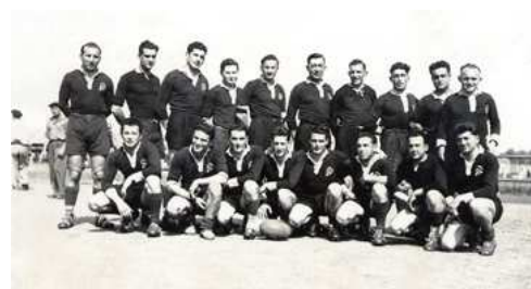
Équipe du C.A.B., saison 1946-1947.