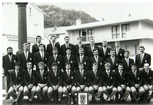
Équipe de l'A.S.B., finaliste du championnat de France de 3 e division. Collection de l'Amicale sportive bortoïse. Arch. dép. de la Corrèze, 20 Num 56.

Total : 8 NOMADICS conditionnés dans 8 containers + 13 QUICKSCREEN conditionnés dans 13 sacs