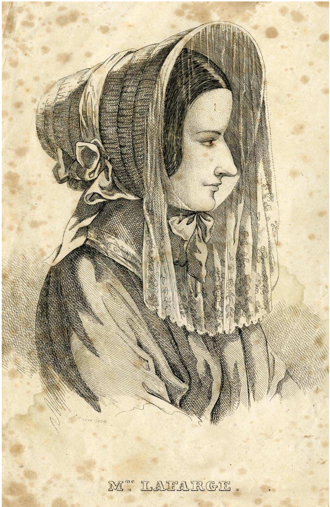
Marie Fortunée Pouch-Lafarge née CAPELLE (1816-1852).