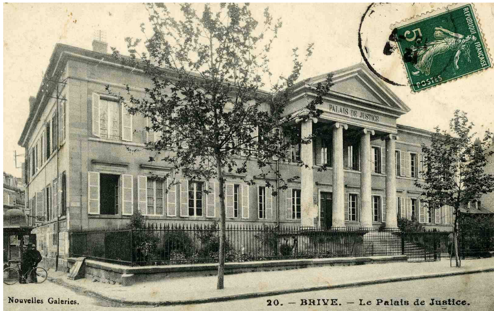
Palais de justice de Brive-la-Gaillarde, [vers 1900]. Arch. dép. de la Corrèze, 5 Fi 31/730.