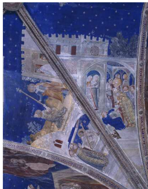
Matteo Giovanetti, « Vie de saint Martial », fresque du palais des papes, voûtain sud de la chapelle Saint-Martial : Scène de la guérison de la fille d'Armulfus.

Chapiteau : découvertes des reliques de saint Etienne à Lubersac