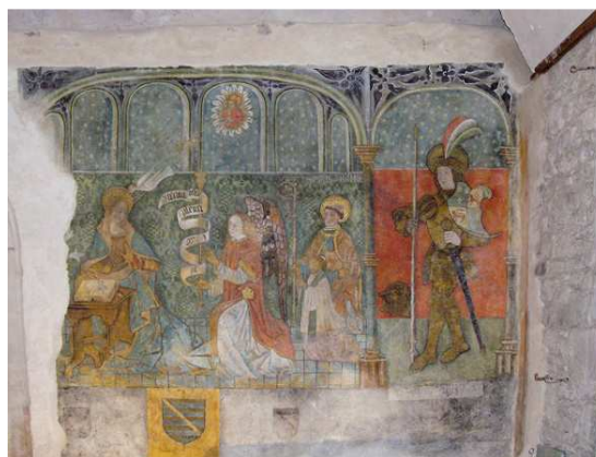
Fresque de l'Annonciation dans l'église Saint-Pardoux de Gimel-les-Cascades (fin du XV e et XVII e siècles).

Arch. dép. Corrèze, 1 Num 2052. © Cliché CAO de la Corrèze, Michelle Vallière.