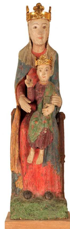
Vierge à l'enfant en majesté, XII e -XIII e siècles.

Total : 2 stands parapluie conditionnés dans 2 containers + 26 dérouleurs conditionnés dans 26 sacs + 6 totems rétro éclairés + 3 kakémonos.