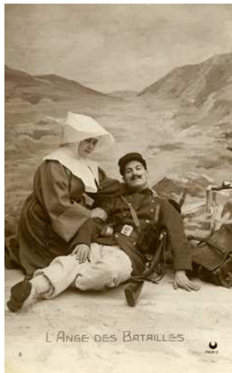
Carte postale. « L'ange des batailles ».

Catalogue : Mendes (Julien), Hôpitaux et blessés de guerre 14-18, du front vers la Corrèze ; Brive, 2014, 95 p. , 15 euros.