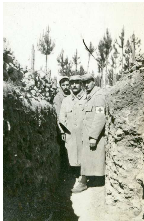
Infirmiers dans une tranchée du secteur de Regniéville-sur-Meuse.