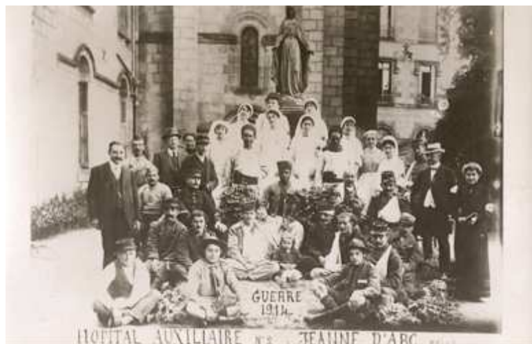
Personnel médical, administrateurs et blessés en convalescence à l'hôpital auxiliaire n° 2 installé dans l'école Jeanne-d'Arc à Brive. 1914. Arch. dép. Corrèze, 47Fi 17. Fonds Most.

Catalogue : Mendes (Julien), Hôpitaux et blessés de guerre 14-18, du front vers la Corrèze ; Brive, 2014, 95 p. , 15 euros.