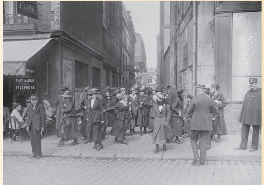
Enquête sur la mode féminine. Plaquette de prestige publiée par HIGH-LIFE TAILOR ; texte signé J.R. ; ill. de Bernard B. de Monvel, Maurice Leloir, L. Sabattier,.... 27 août 1928.

7) Décrivez les tenues des femmes représentées sur les documents 3 et 4.